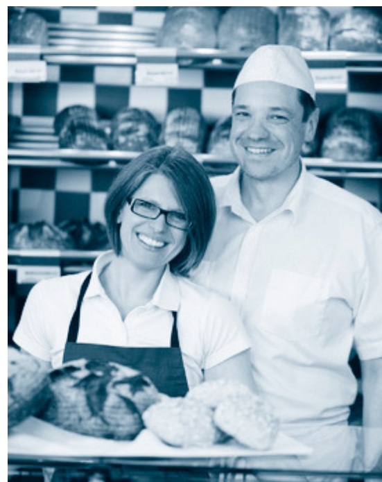
Die Verlässlichkeit des Partners ist ein wichtiges Motiv für die Beschäftigung im Unternehmen

Beweggrund für eine Beschäftigung des Ehepartners ist in den meisten Fällen weder die Vorbereitung auf eine spätere Unter-