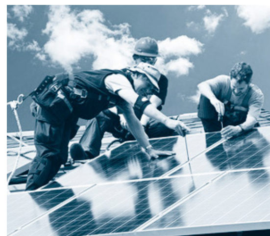
In Betrieben des Baugewerbes werden die meisten Familienmitglieder beschäftigt

Wurde angegeben, dass Familienangehörige im Unternehmen beschäftigt sind, so sind vor allem größere Mittelständler der Arbeitgeber für mehr als nur ein Familienmitglied. Das heißt, verfügen Unternehmen über mithelfende Familienangehörige, so stehen bei Unternehmen mit einer Belegschaftsgröße von über 250 Personen